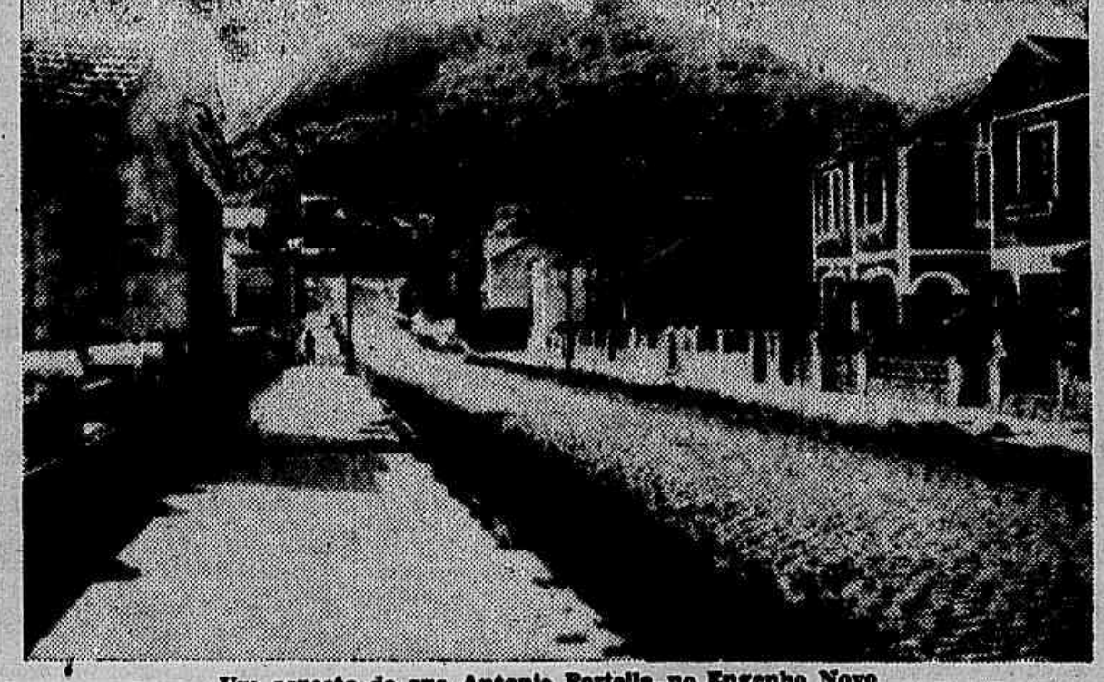
Um aspecto da rua Antonio Portella no Engenho Novo

No tempo da Colonia existia no Rio uma praça com o nome pittoresco de largo do Capim. E esse nome, mais modernamente poderia ser dado á rua Antonio Portella, no Engenho Novo. O matto invadiu a rua abundantemente. E esse o atestado mais flagrante do esquecimento a que votaram aquella arteria, onde já reponta a architectura dos "bungalows". Mas não é só a vista que sofre, ao percorrel-a. Tambem o olfacto. Porque, dadas umas fossas existentes nella, máo grado a rede de agua e esgoto já a ter atingido, exhalam um odor pestilento e que máis se pronuncia nos dias quentes. Se no primeiro caso é só um ponto de esthetica que se tem a lamentar, este segundo é máis importante em vista das consequencias que pode ter para a saúde dos moradores. Por máis de uma vez se tem clamado junto aos poderes publicos para o desmatar em que se acha aquelle trecho da nossa capital. Infelizmente, até hoje, taes reclamações não têm surtido o minimo effeito. Já era tempo de se volver as vistas para a rua Antonio Portella, sanando esses inconvenientes que a estão tornando inhabitavel.